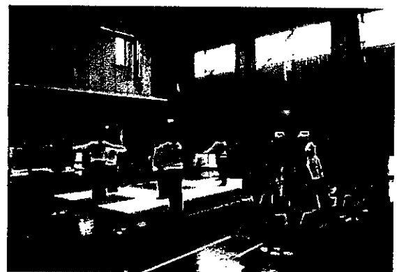
スローフラダンス