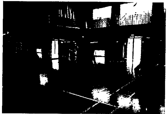
体幹めざまし体操