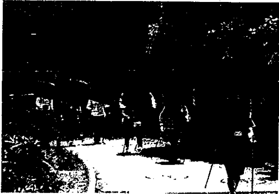
ハルティックウォーキング体験教室